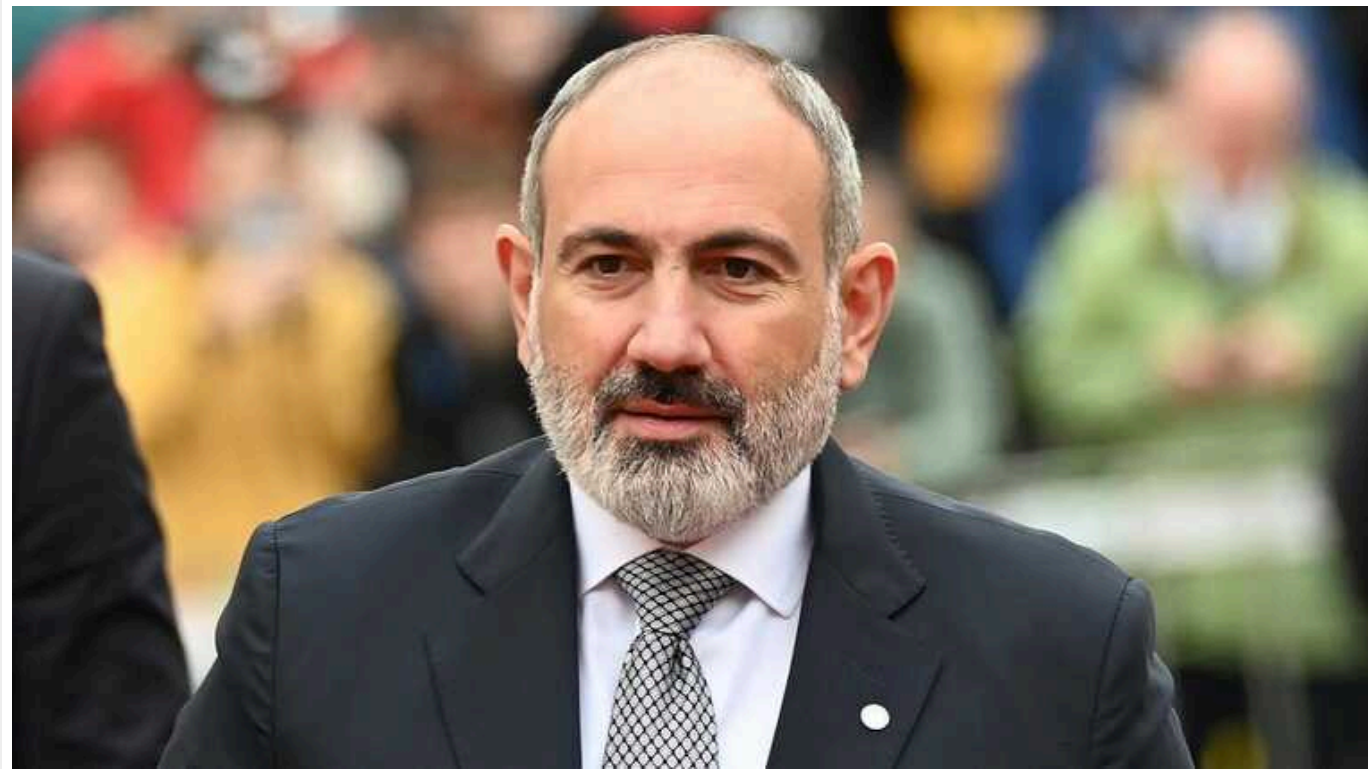
Пашинян заявив, що Вірменія більше не може покладатись на Росію: "Ненадійний партнер"

Вірменія більше не може покладатись на Росію як на свого головного оборонного та військового партнера, оскільки Москва неодноразово підводила її. Тому Єреван повинен подумати про встановлення тісніших зв'язків зі Сполученими Штатами та Францією.