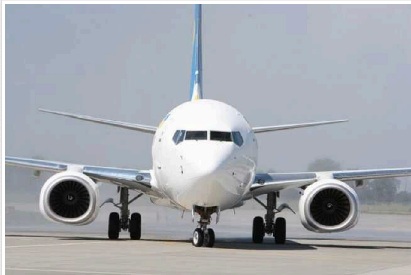
В Україні судитимуть колишнього віцепрезидента великої авіакомпанії: "обікрав" аеропорт "Бориспіль" на мільйони

В Україні судитимуть колишнього віцепрезидента ПрАТ "Міжнародні авіалінії України" (МАУ). Його звинувачують у заволодінні понад 10 млн грн "Міжнародного аеропорту" "Бориспіль".