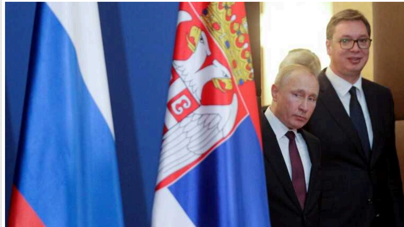
Сербія розширює військову та цивільну співпрацю з Росією: підписали новий меморандум між міністрами охорони здоров'я

Сербія та Росія ще більше зміцнили свої зв'язки, підписавши угоду про охорону здоров'я між двома країнами. Крім того, було оголошено про постачання російських безпілотників Белграду.