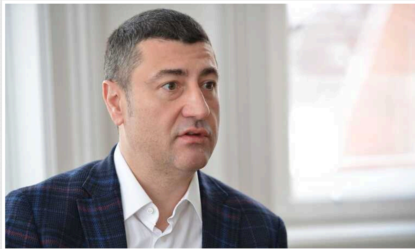
Найбільший хабар в історії України: Справу Бахматюка направили до суду

Бізнесмена судитимуть за підозрою у наданні 722 млн грн хабара екславі ДФС Роману Насірову.