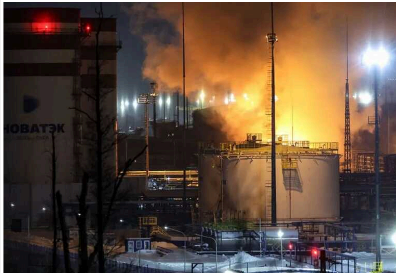
РФ втратила вже 37% експорту бензину через удари дронів по НПЗ

Росія в січні 2024 року втратила 37% експорту бензину та 23% експорту дизельного палива. Невтішну статистику пов'язують із атаками безпілотників на великі об'єкти нафтогазової інфраструктури країни-агресора. Місцеві експерти вже порівнюють ситуацію з торішніми ударами самої РФ по українській енергетиці та зазначають, що тепер "настала черга Росії".