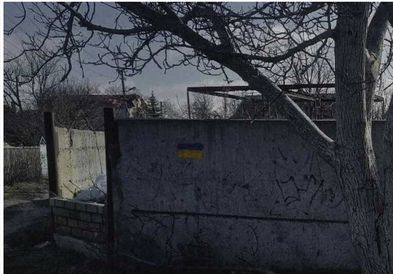
В окупованих Олешках біля будинку, де поселилися загарбники, з'явилися графіті з синьо-жовтим прапором

На тимчасово окупованій території Херсонщини рух опору продовжує демонструвати загарбникам, що вони не бажані на українській землі. Так, в Олешках біля будинку, де поселилися окупанти, українці намалювали графіті з тризубом і синьо-жовтим прапором.