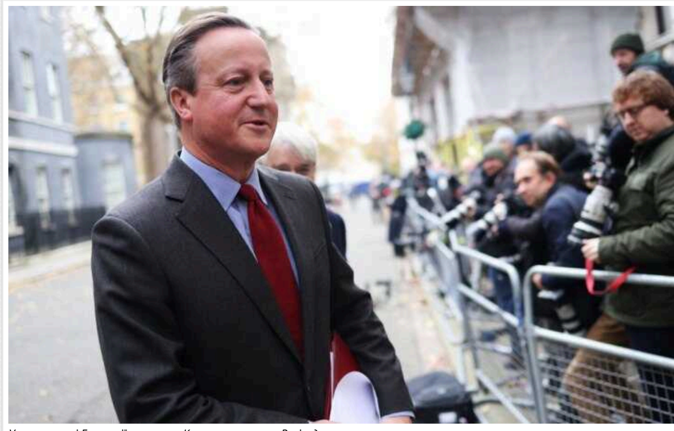
У парламенті Британії закликали Кемерона визнати Росію державою-спонсоркою тероризму

Група з 13 депутатів парламенту Великої Британії та п'яти перів заклікала міністра закордонних справ Девіда Кемерона визнати РФ державою – спонсоркою тероризму. На їхню думку, це, зокрема, відкриє шлях до конфіскації заморожених Лондоном російських активів.