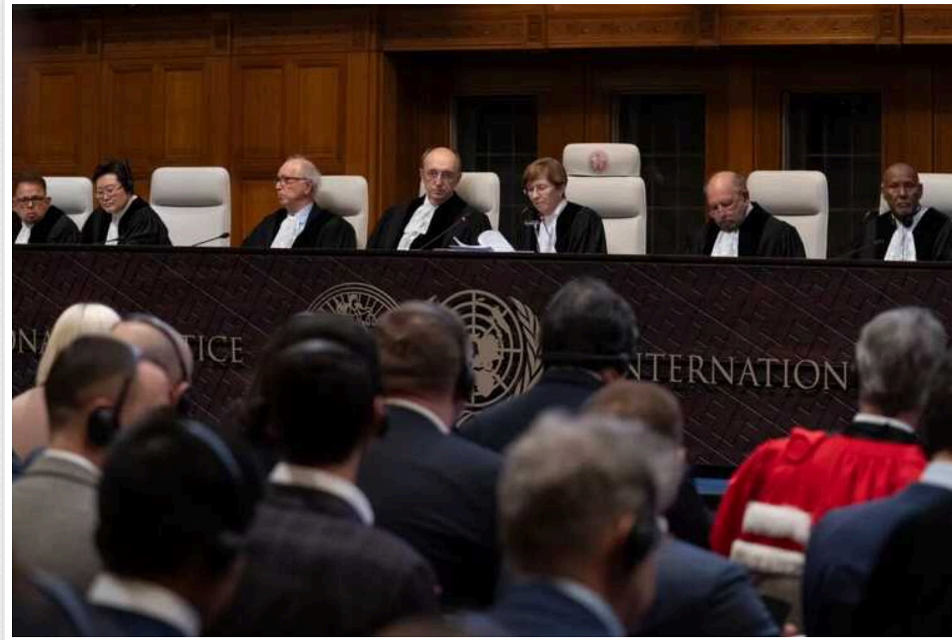
Суд у Гаазі визнав свою юрисдикцію у справі України проти Росії щодо "геноциду"

Міжнародний суд Організації Об'єднаних Націй у Гаазі (Нідерланди) ухвалив рішення розглянути справу України проти Росії про "геноцид" далі по суті. Суд також заявив, що має юрисдикцію розглядати запит України про те, що вона не порушувала своїх зобов'язань за Конвенцією щодо запобігання злочину геноциду та покарання за нього у Донецькій і Луганській областях.