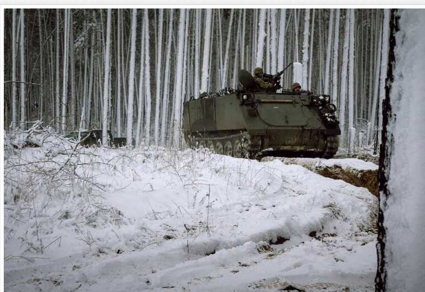
Ситуація на фронті: ЗСУ відбили атаки армії РФ на восьми напрямках і продовжують утримувати плацдарми на лівобережжі Дніпра

Протягом 709-ї доби повномасштабного вторгнення на фронті відбулось 55 бойових зіткнень. ЗСУ відбили атаки ворожої армії на восьми напрямках та продовжують утримувати плацдарми на лівобережжі Херсонщини. Найбільше російських штурмів відбито на Авдіївському, Куп'янському та Лиманському напрямках.