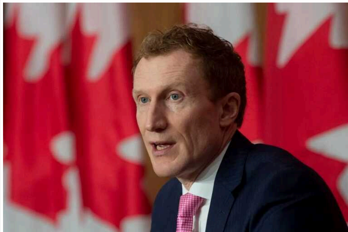
У Канаді виділили 362 мільйонів доларів на житло біженцям

За словами міністра з питань імміграції Марка Міллера, 100 млн від цієї суми підуть провінції Квебек.