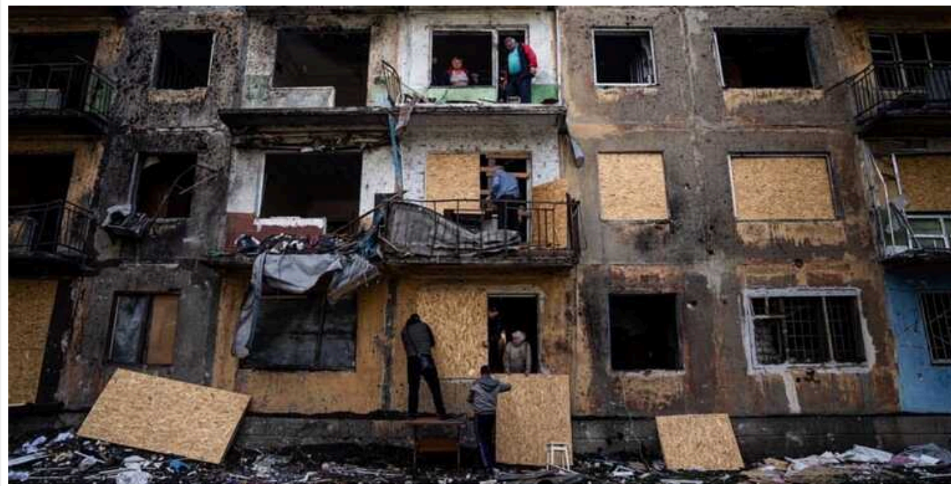
У Дніпрі міськрада віддала ремонтувати пошкоджені російськими ракетами будинки новоствореній компанії

За січень 2024 року Департамент з питань самоорганізації населення Дніпровської міської ради уклав 18 угод з новоствореною компанією на ремонт будинків у місті. Очікувана вартість підрядів складає 16,4 млн грн.