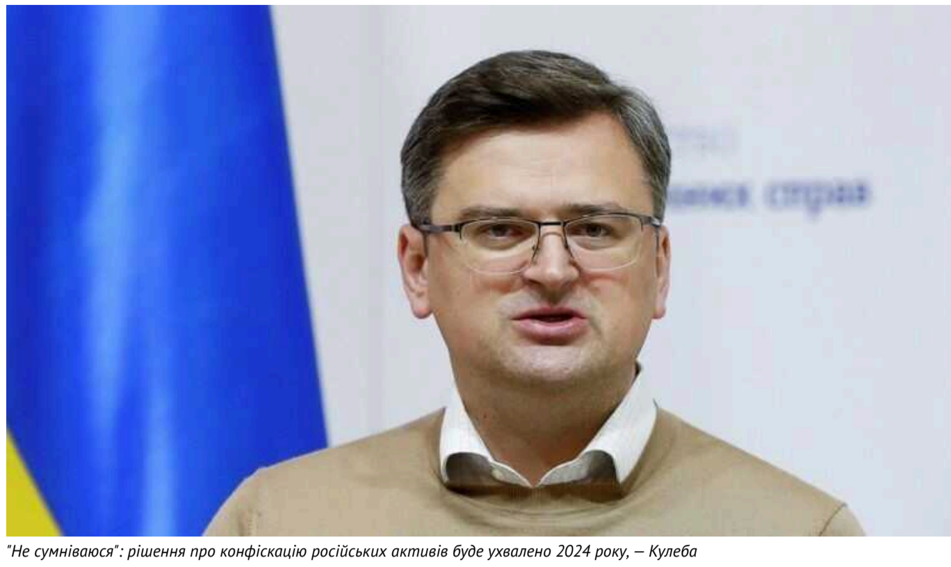
"Не сумніваюся": рішення про конфіскацію російських активів буде ухвалено 2024 року, — Кулеба

За словами українського дипломата Дмитра Кулеби, рішення щодо заморожених активів противника може бути ухвалене частинами, а не комплексно, однак перші результати мають бути найближчим часом. Динаміка дискусії висока.