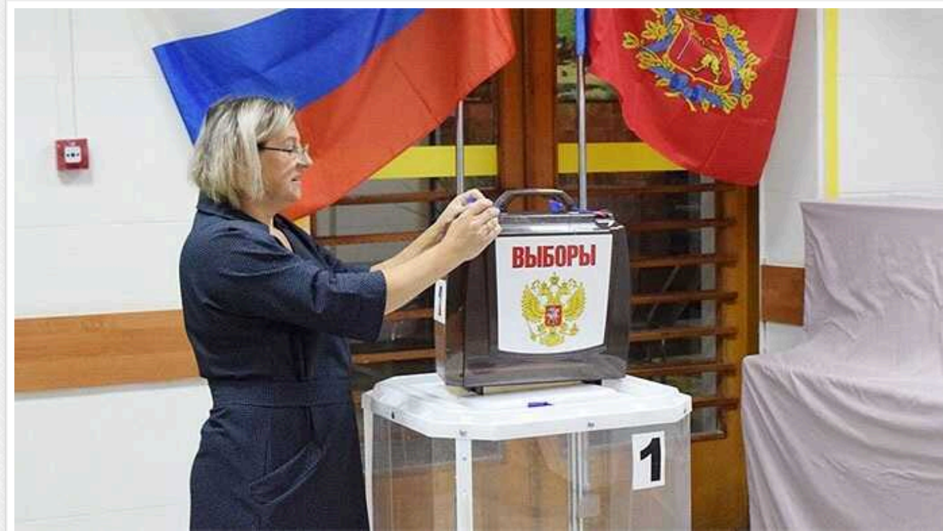
Росіяни очікують від виборів президента в РФ завершення війни проти України, – опитування

Очільника Кремля Володимира Путіна у відкритому опитуванні більшість назвали політиком, який представляє їхні інтереси.