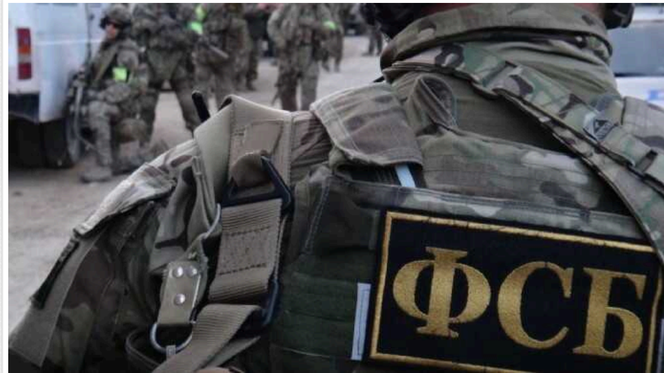
Хотів 400 тисяч рублів: окупант намагався продати "Мавік", що належить Міноборони РФ, – РосЗМІ

За даними журналістів, оголошення російського військового про продаж квадрокоптера помітили співробітники ФСБ, після чого чоловіка затримали.