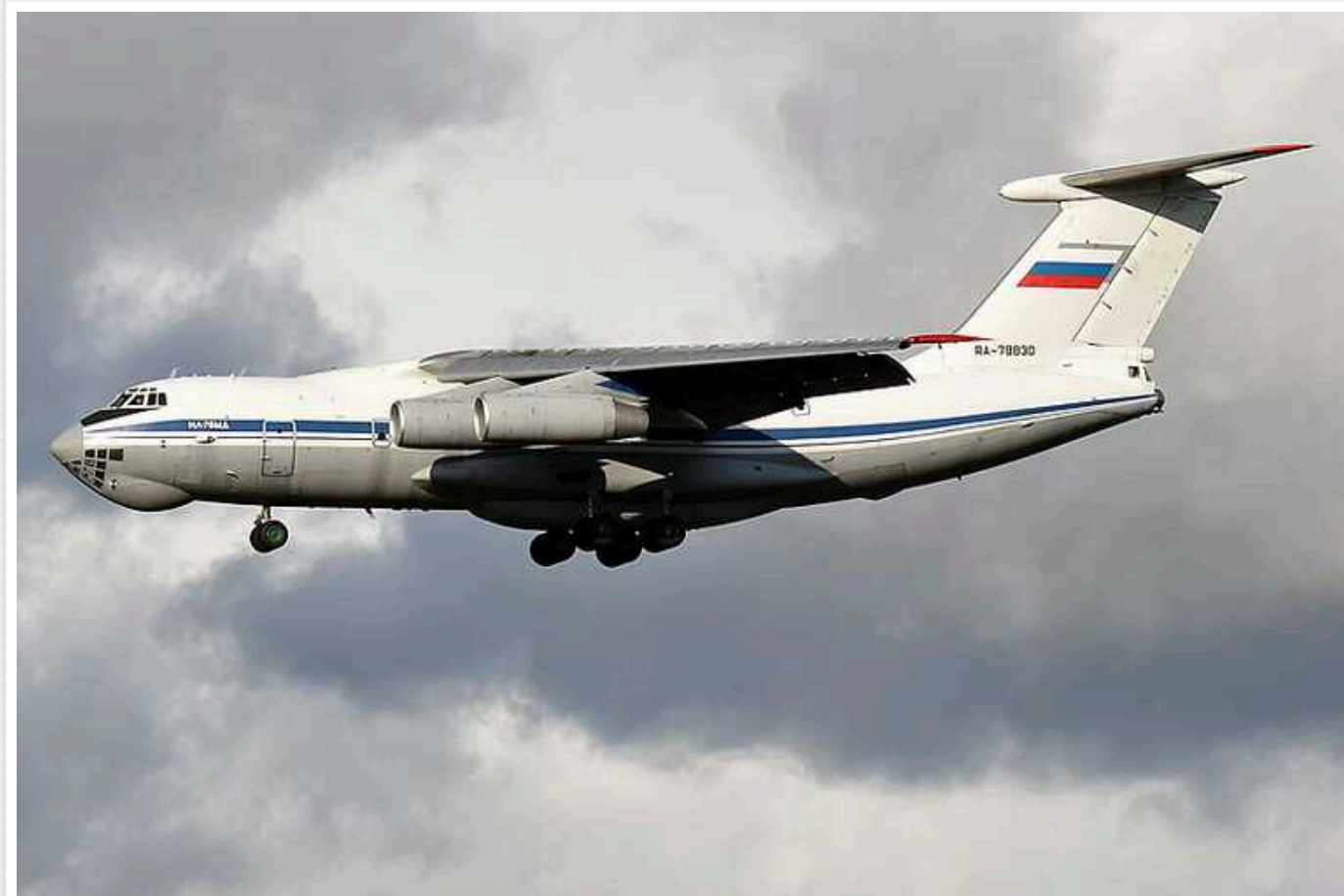
США в ОБСЄ: РФ не надала доказів своєї версії авіакатастрофи Іл-76

Країна-агресор Російська Федерація не представила жодних підтверджень щодо своїх заяв про авіакатастрофу Іл-76, яка сталася 24 січня у Белгородській області. Кремль не допускає на місце аварії ні незалежних представників ЗМІ, ні експертів.