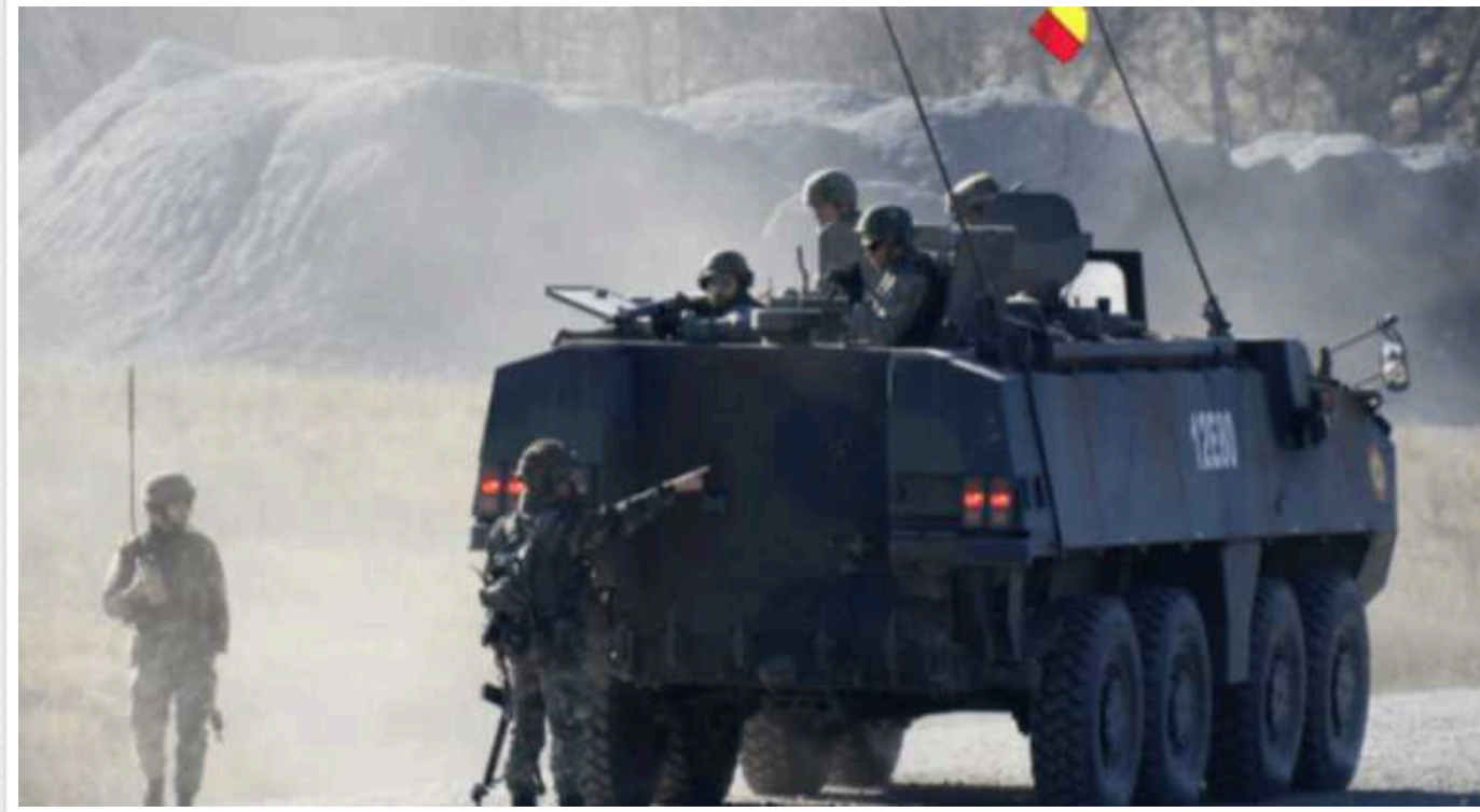
Румунський прем'єр заперечив можливу підготовку до протистояння з Росією

Очільник румунського уряду Марчел Чолаку заявив, що ніяких заходів для готовності до потенційної війни у його країні не відбуватиметься.