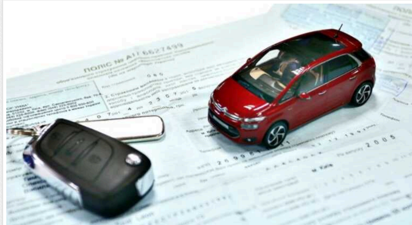
В Україні змінять систему автострахування: що потрібно знати водіям

Страхове законодавство в Україні приведеуть у відповідність до норм ЄС. Очікується збільшення сум страхових виплат, але ї поліси можуть подорожчати внаслідок впровадження вільного ціноутворення.