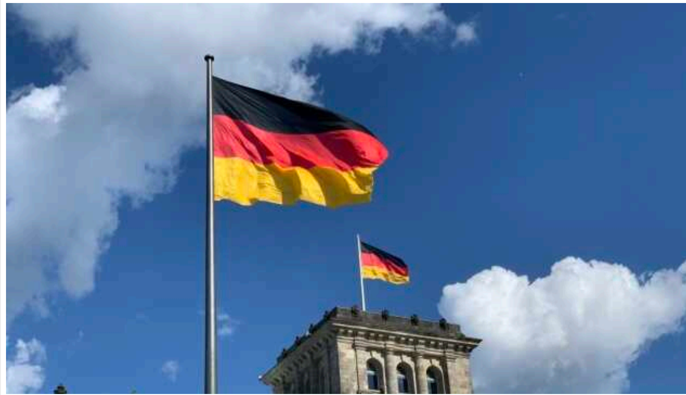
Німецький Бундестаг затвердив держбюджет на 2024 рік з допомогою для України

Депутати німецького Бундестагу 2 лютого ухвалили державний бюджет ФРН на 2024 рік.