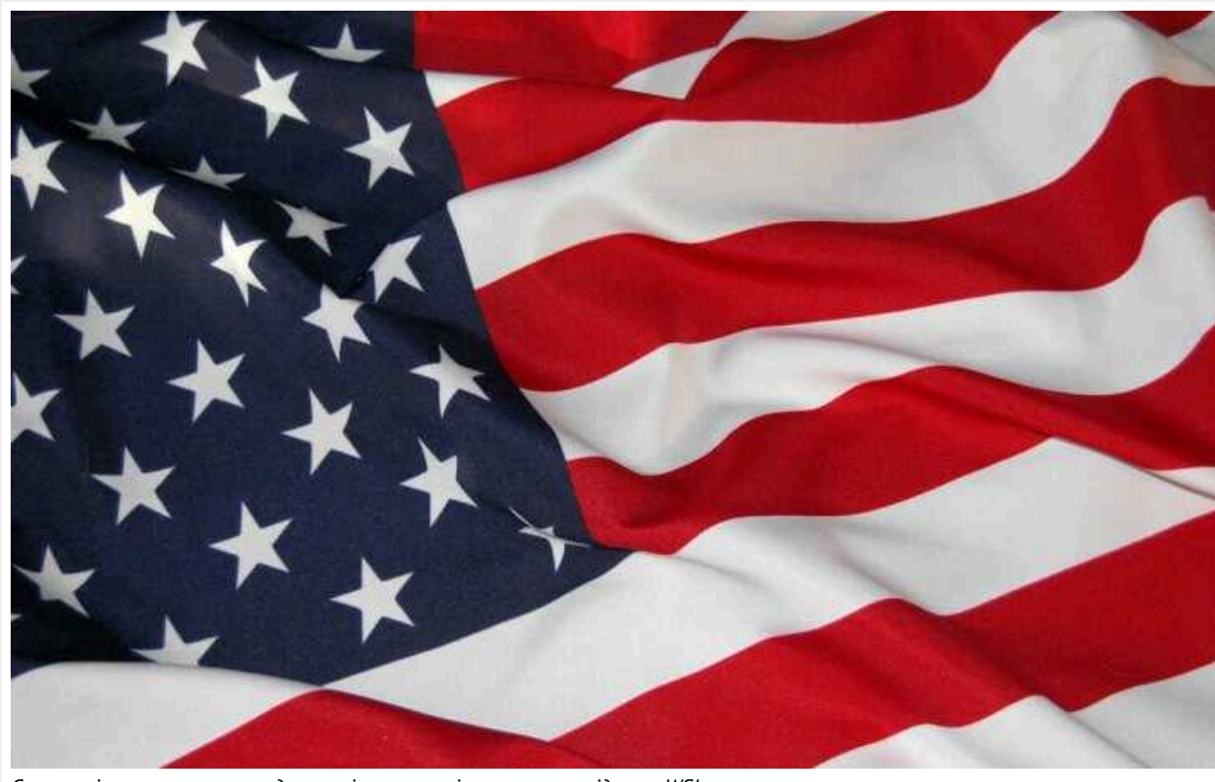
Сполучені штати почнуть удари по іранських цілях вже на вихідних – WSJ

США вже цими вихідними планують завдати ударів по численних цілях в Іраку та Сирії у відповідь на атаку на свою базу в Йорданії, внаслідок якої загинули троє військових, повідомляє The Wall Street Journal з посиланням на американських посадовців.