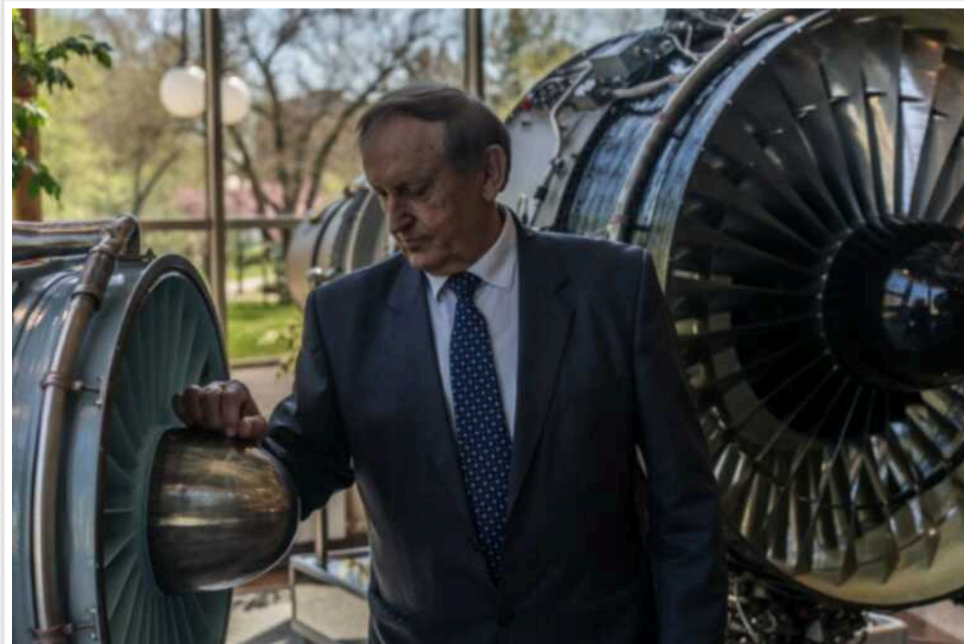
Богуслаєва доставили у ВАКС для розгляду справи про конфіскацію активів

У судовому засіданні Вищого антикорупційного суду (ВАКС) у справах за позовами Міністерства юстиції про застосування санкцій у вигляді стягнення активів в дохід держави вперше бере участь підсанкційний – експрезидент АТ "Мотор Січ" В'ячеслав Богуслаєв.