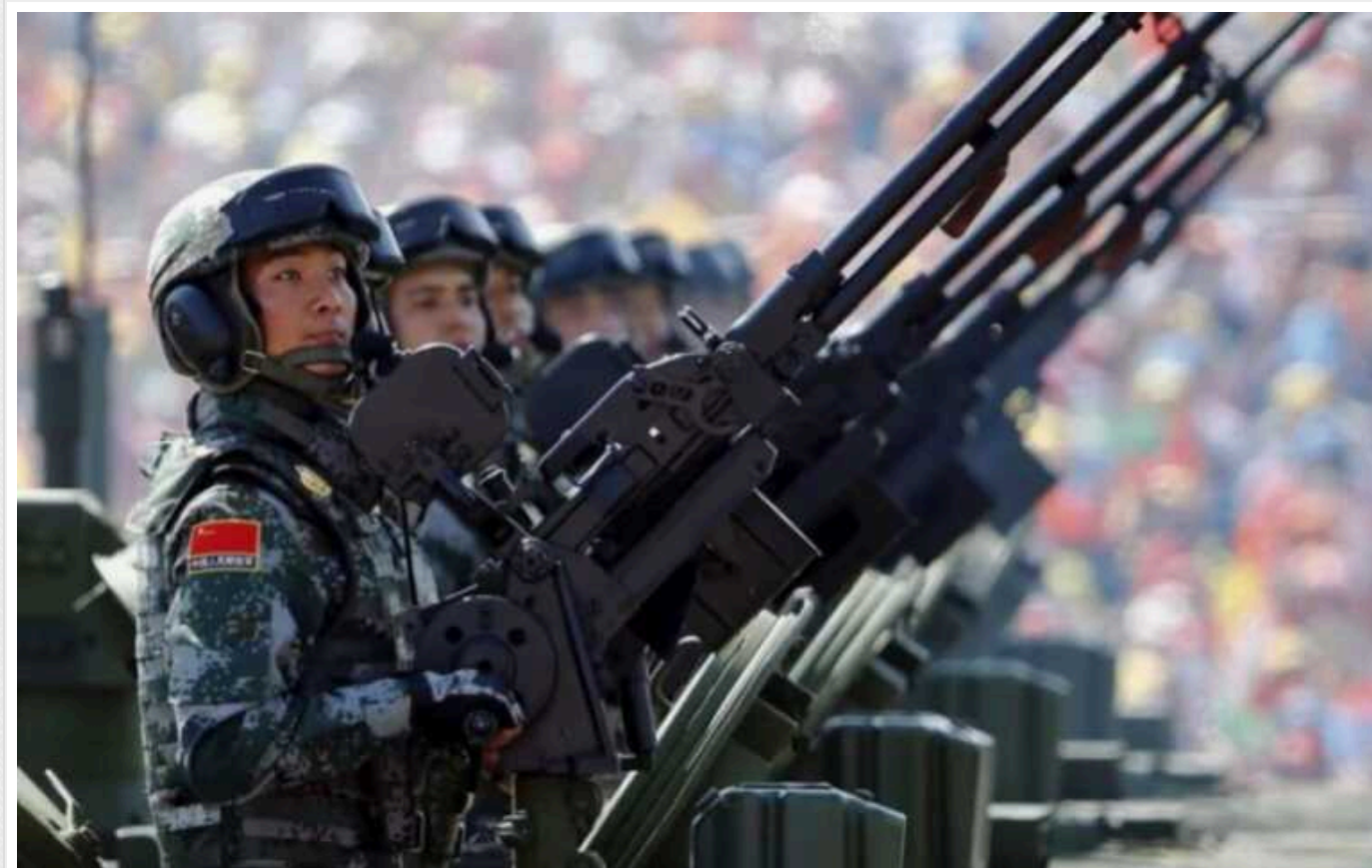
Військова кампанія КНР проти Тайваню буде максимально швидкою, — адмірал США

Китай уважно стежить за тим, як проходить війна в Україні. Але замість того, щоб усвідомити марність такої агресії, спробує повалити керівництво Тайбея в найкоротші терміни.