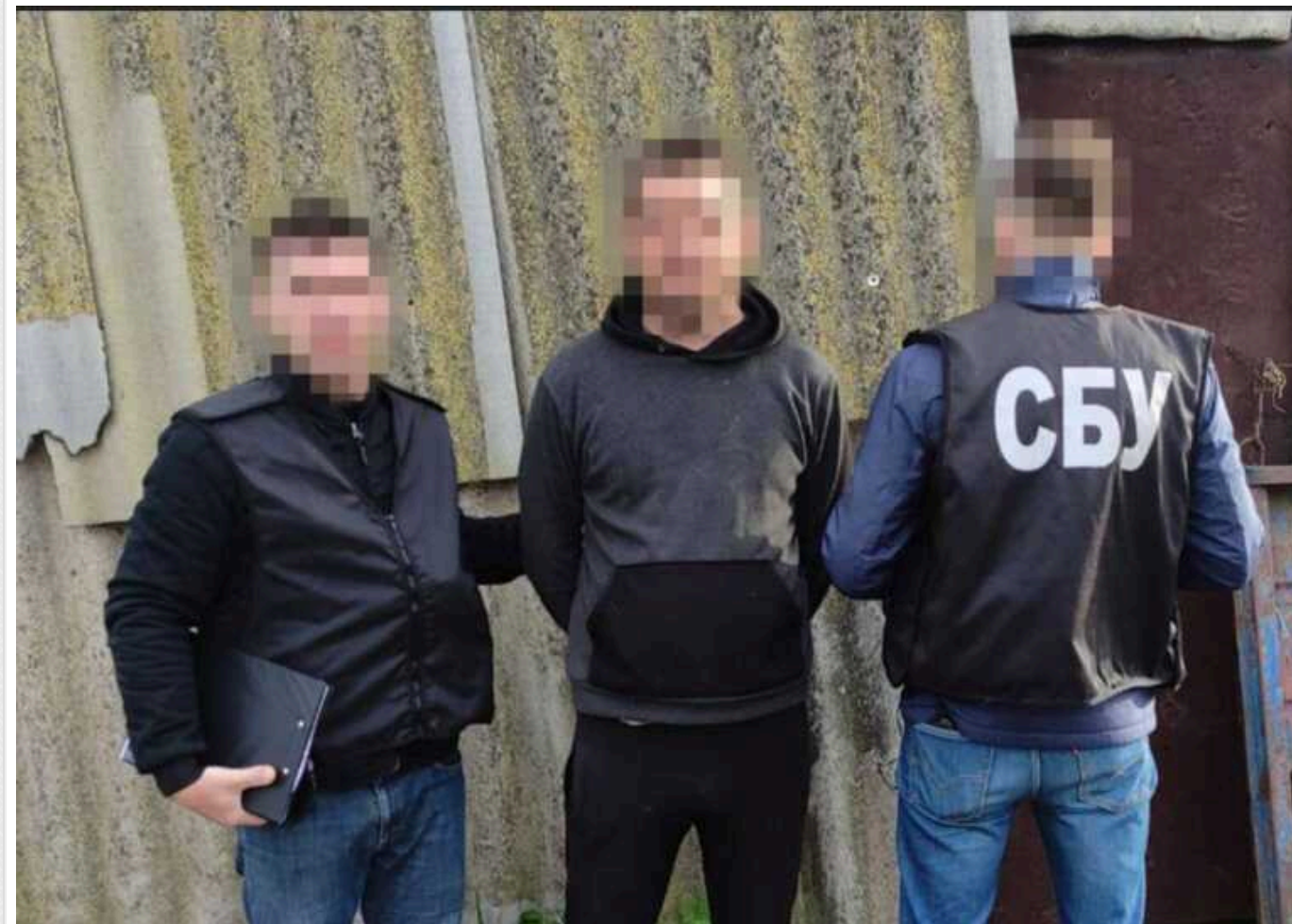
СБУ затримала бойовика, який під час битви за Миколаївщину «здавав» українців на російських блокпостах

Фігурантом виявився мешканець Снігурівщини. Після її захоплення він допомагає загарбникам перевіряти місцевих жителів, які намагалися виїхати на підконтрольну Україні територію.