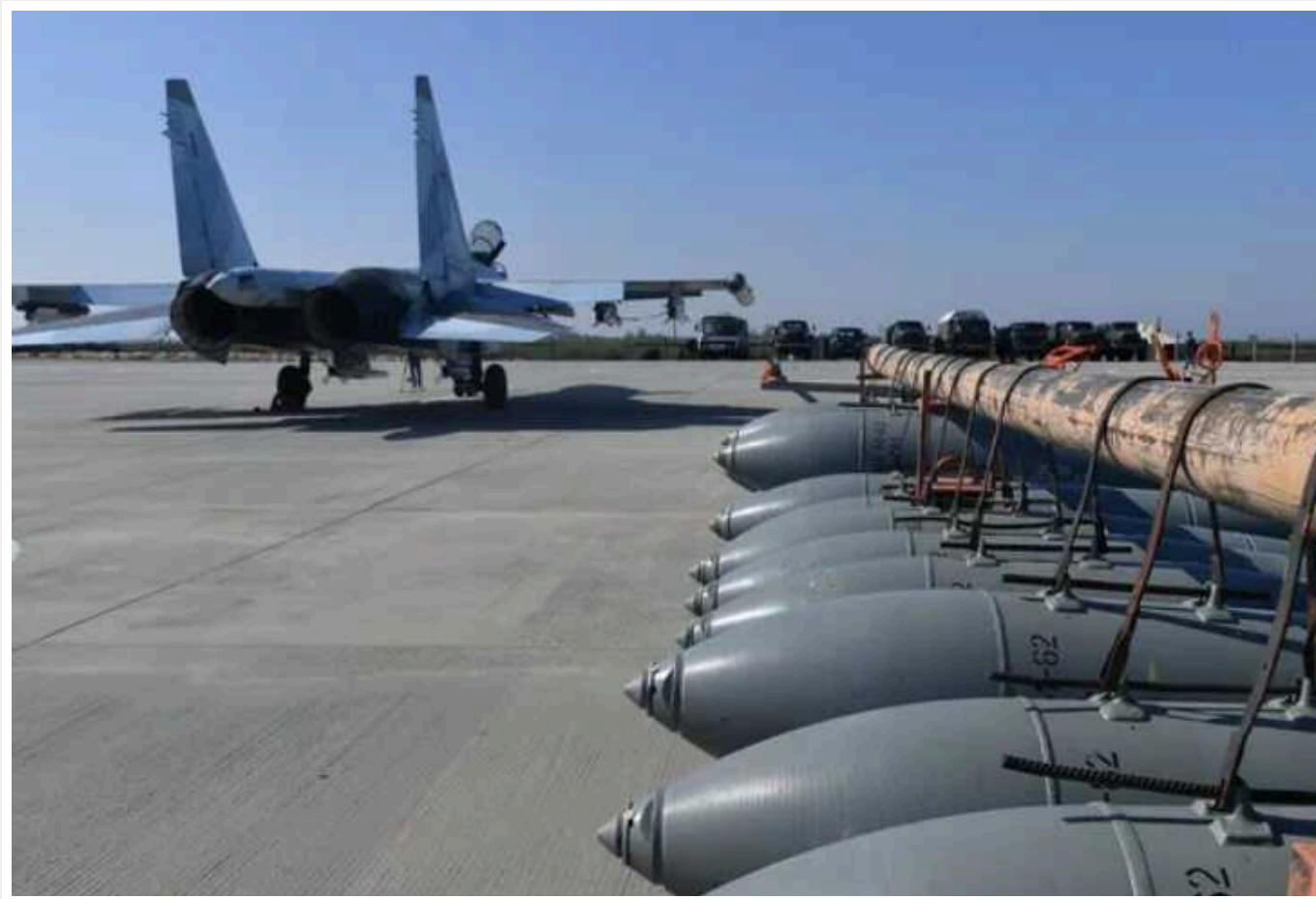
Літак росіян на окупованій Луганщині знову "загубив" бомбу

Військовий літак РФ вкотре "загубив" авіабомбу. Цього разу НП сталася в місті Зимогор'я на окупованій території Луганщини.