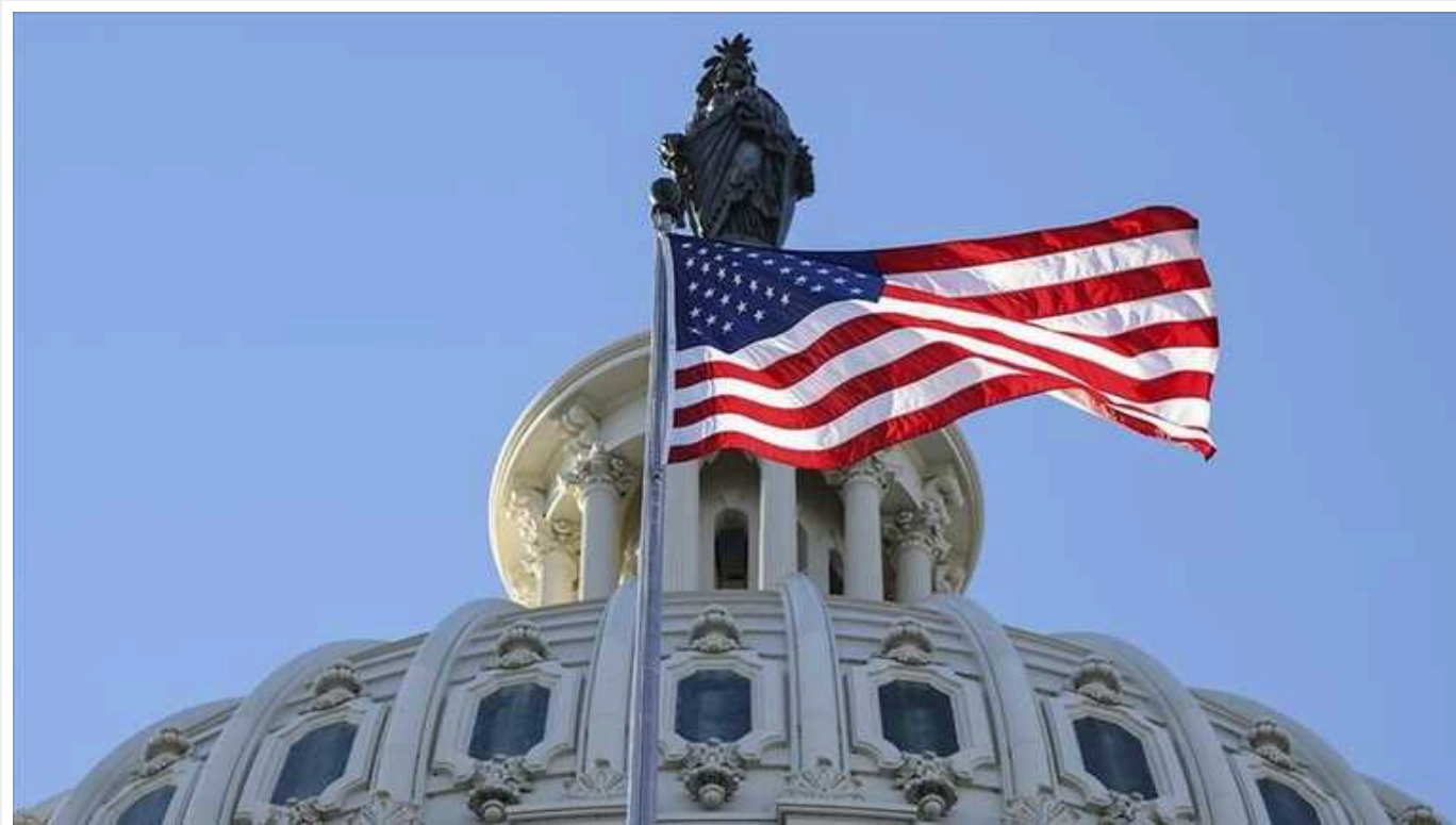
У США співробітника ЦРУ засудили на 40 років за шпигунство

Колишнього співробітника ЦРУ Джошуа Шульте, який кілька років тому передав проекту WikiLeaks великий об'єм секретних документів про інструменти співробітників Центрального розвідувального управління США, засудили до 40 років в'язниці.