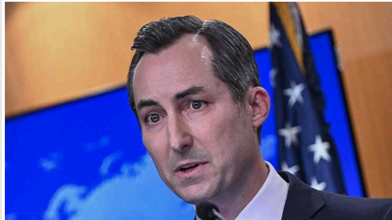
Держдеп США про "демлітаризовану зону" Путіна: РФ могла б почати першою

Державний департамент Сполучених Штатів, реагуючи на ідею російського диктатора Володимира Путіна створити "демлітаризовану зону" між Російською Федерацією та Україною, заявив, що для цього Росії потрібно демлітаризувати окуповані частини України.