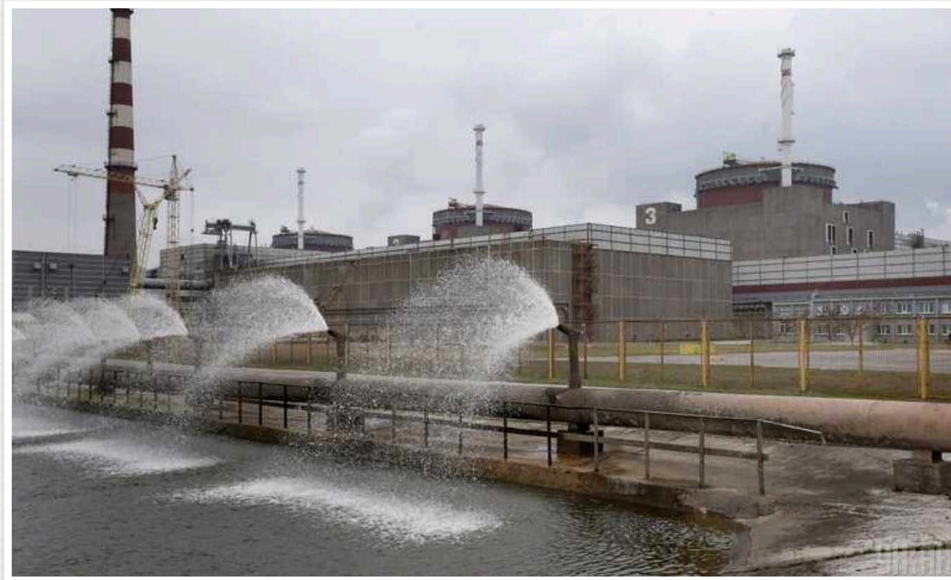
Окупанти вдаються до тиску на працівників ЗАЕС, які з ними не співпрацюють, – ЦНС

Окупанти тиснуть на працівників Запорізької атомної станції, які відмовились співпрацювати з ворогом, але не залишили Енергодар.