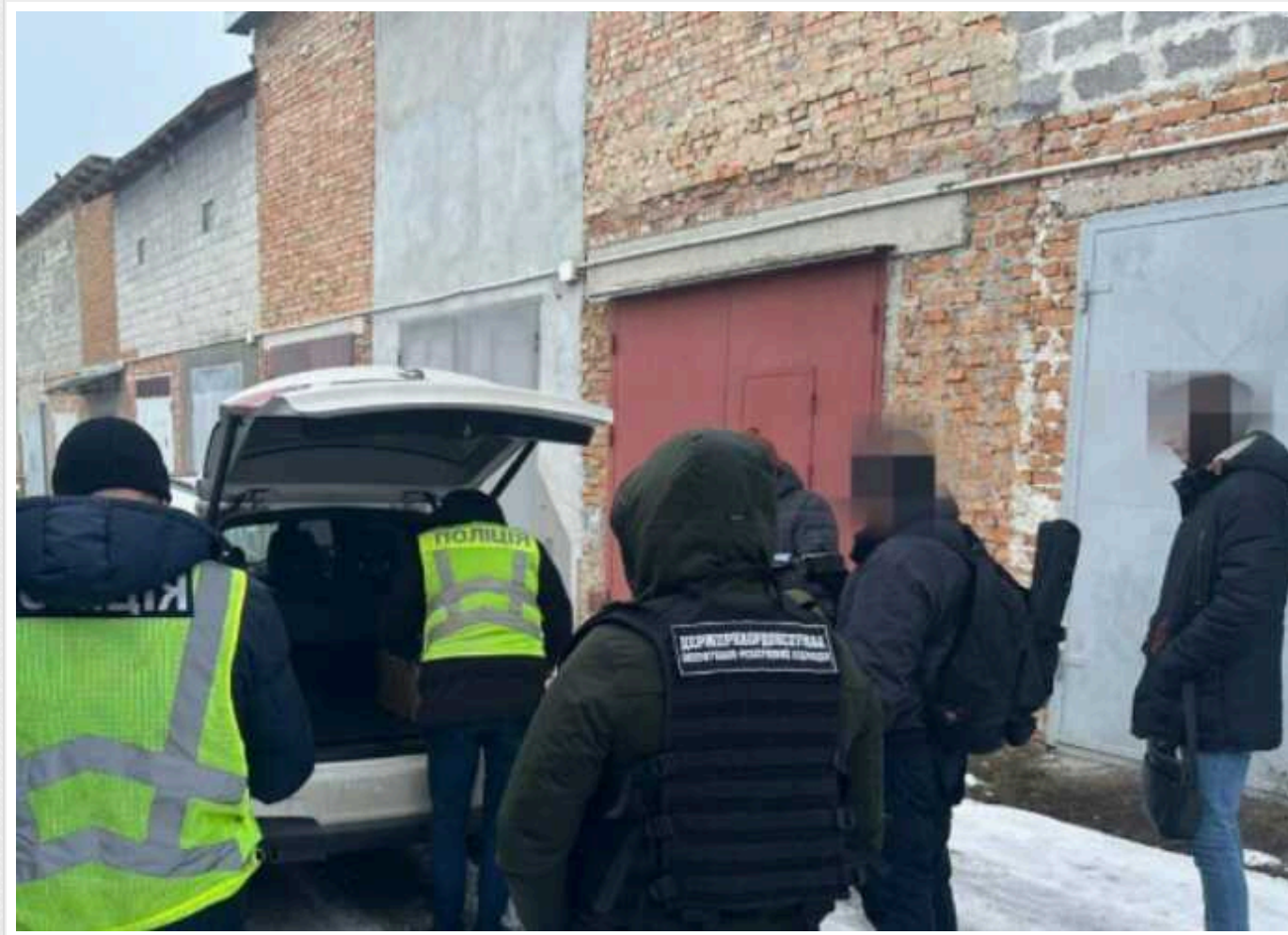
На Тернопільщині викрили схему для ухилантів: майже 50 чоловіків "скористалися послугами"

Правоохоронці в Тернопільській області викрили схему, яка дала змогу 48 чоловікам незаконно виїхати за кордон та уникнути мобілізації.