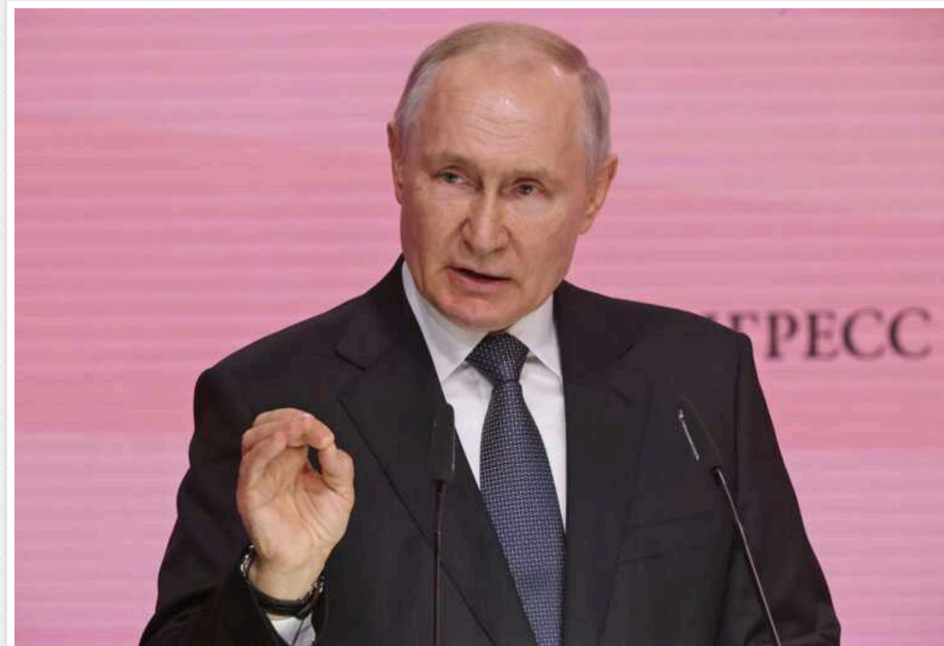
Апетити РФ виходять далеко за межі України, погрози вже лунають, – представник США в ОБСЄ

Держава-агресор Росія чітко висловлюється, що присутність незалежної країни на території, яку Москва вважає "історично своєю", може розглядатися як привід для вторгнення її злочинної армії. Росія є загрозою для багатьох держав і йдеться не тільки про сусідні з РФ території.