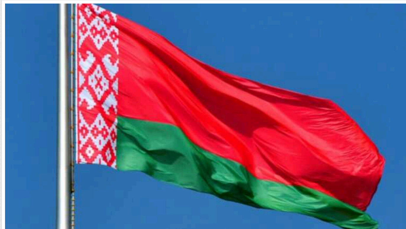
У Білорусі запевнили, що не розглядають жодну країну як ворога: "Воювати не збираємося"

Білорусь не розглядає жодну державу як ворога і "воювати не збирається".