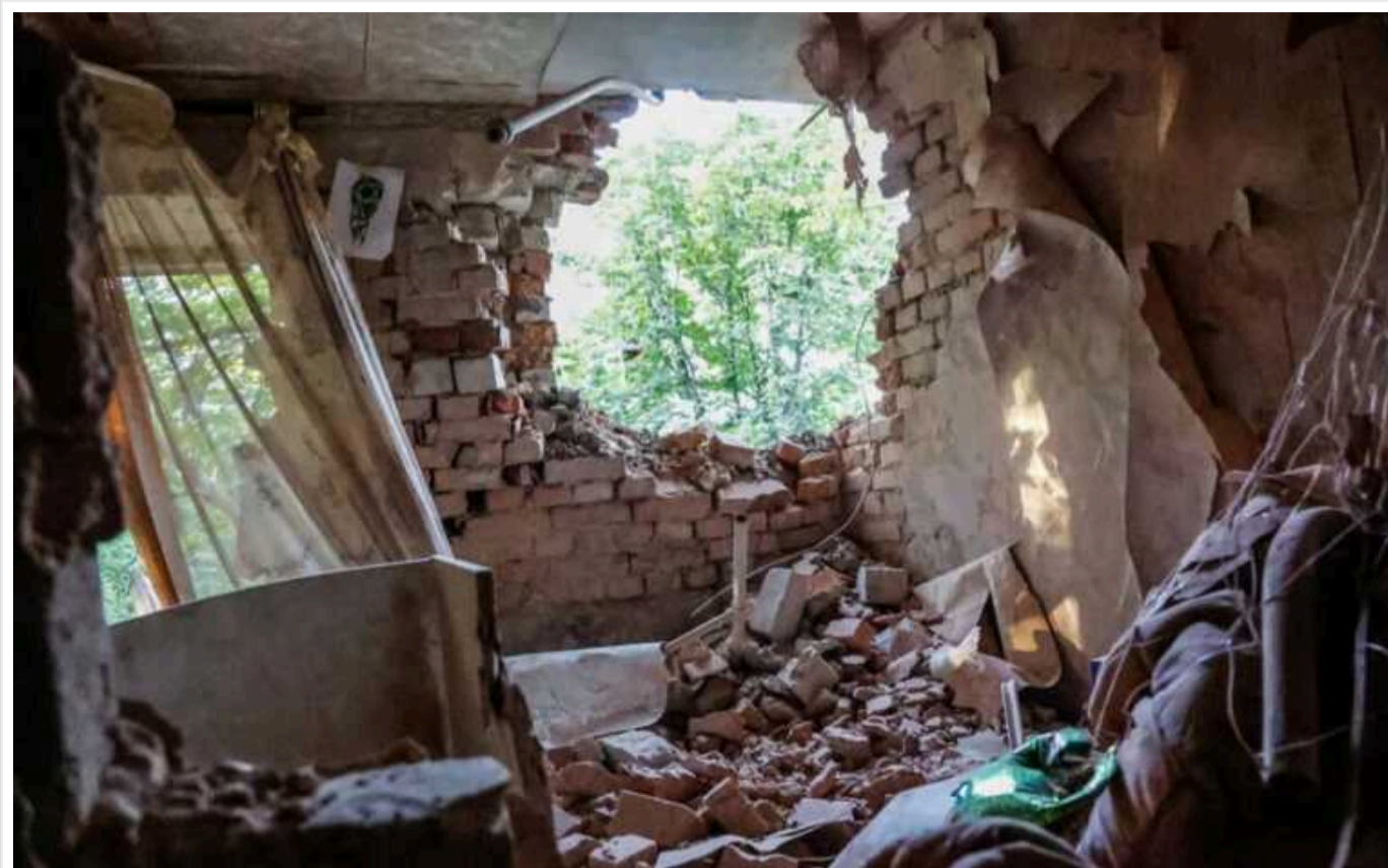
За програмою "єВідновлення" на ремонти пошкоджених домівок українці витратили менше третини перерахованих коштів

Переважну більшість коштів з компенсації "єВідновлення" за пошкоджене житло українці використали на будівельні матеріали: з понад 1 млрд гривень, які постраждалі родини витратили на ремонт, 864 млн пішло на купівлю деревини та будівельних матеріалів.