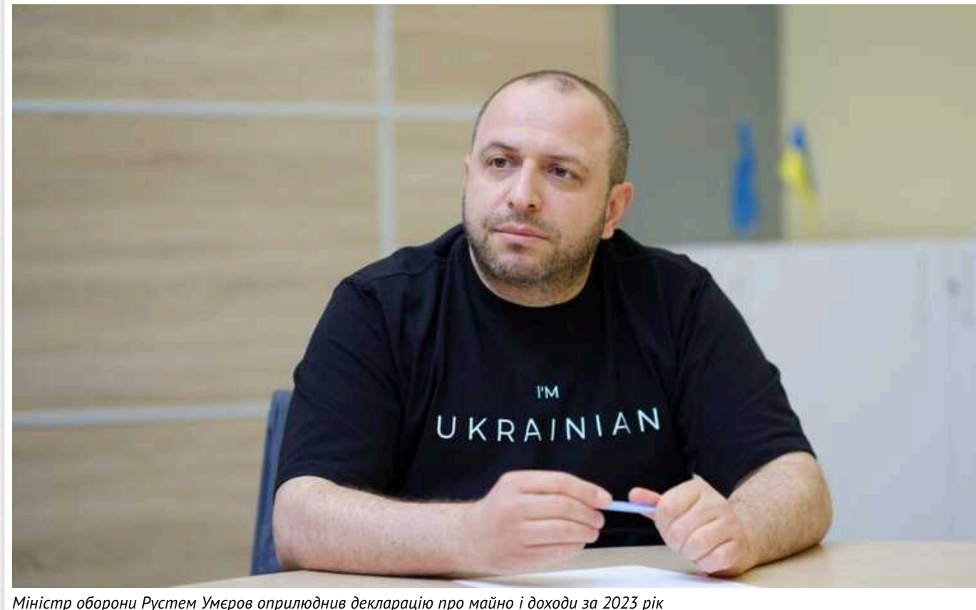
Міністр оборони Рустем Умеров оприлюднив декларацію про майно і доходи за 2023 рік

Міністр оборони України Рустем Умеров оприлюднив декларацію про майно та доходи за 2023 рік. Відповідний документ опублікували на сайті Національного агентства з питань запобігання корупції.