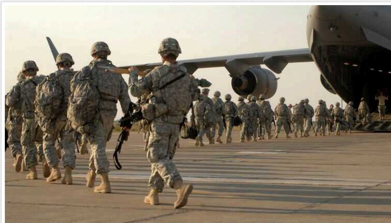
США схвалили план ударів по іранських цілях в Іраку та Сирії

Штати вже схвалили плани завдання серії ударів протягом кількох днів по цілях на території Іраку та Сирії, включаючи іранський персонал і об'єкти.