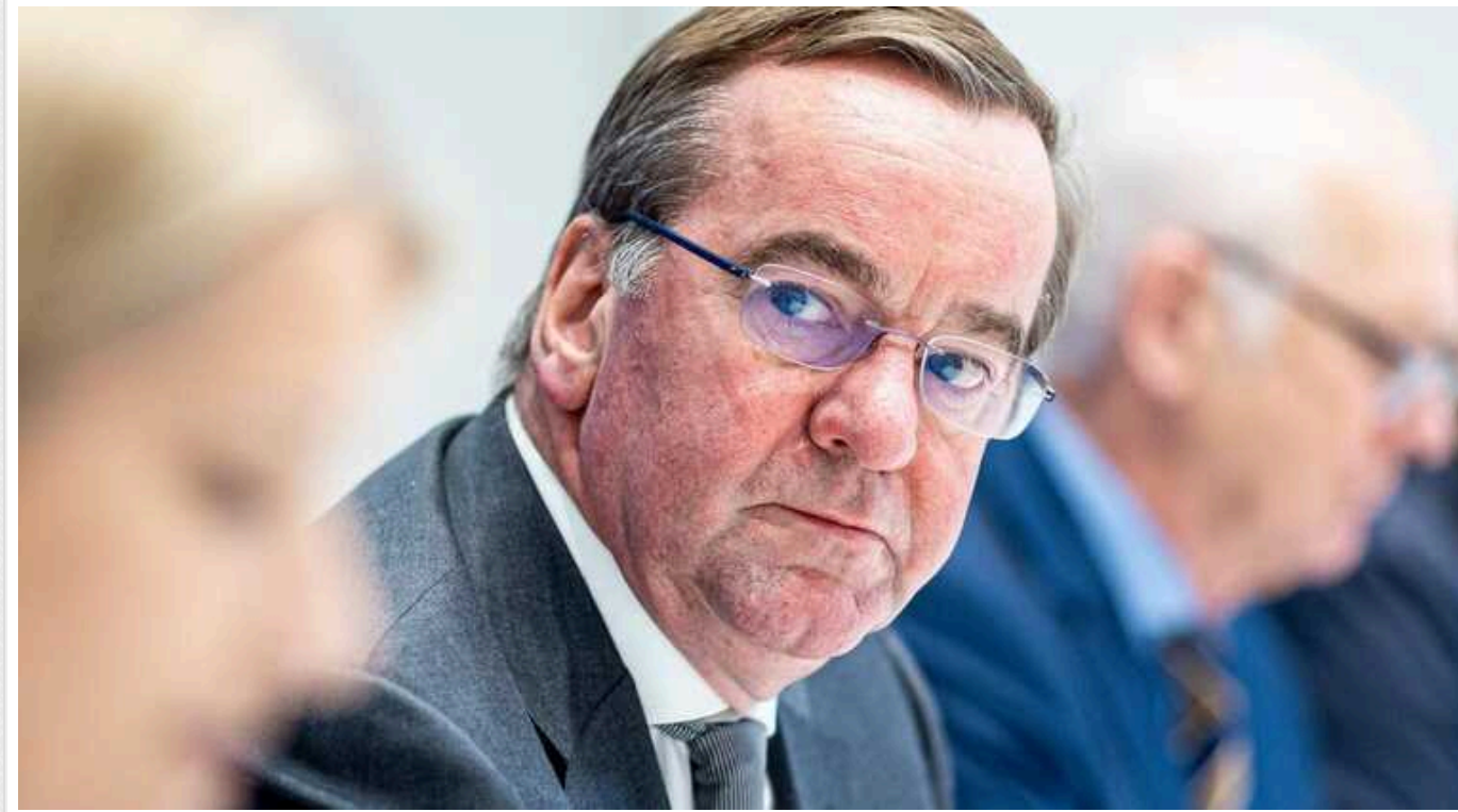
Глава Міноборони Німеччини більше не може слухати дебати про Taurus, – N-TV

Борис Пісторіус "більше не може слухати дебати про Taurus", пише N-TV.