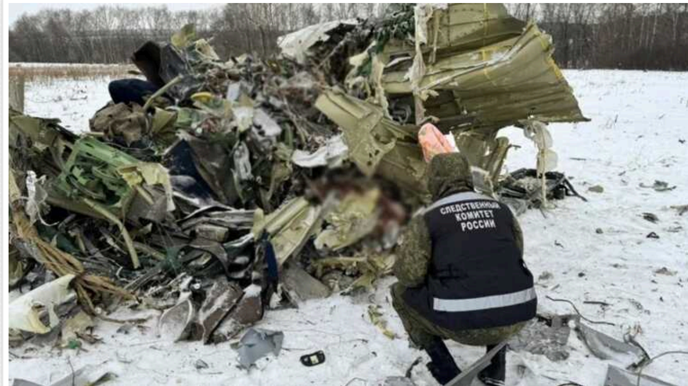
ГУР МО: Росія ігнорує вимогу України віддати тіла військовополонених, нібито загиблих в Іл-76

Українська сторона вже кілька разів зверталася до РФ з приводу передавання тіл, але відповіді так і не отримала. Статус 65 осіб із списку, які нібито перебували на борту Іл-76, не змінився – вони і досі вважаються військовополоненими, кажуть в розвідці.