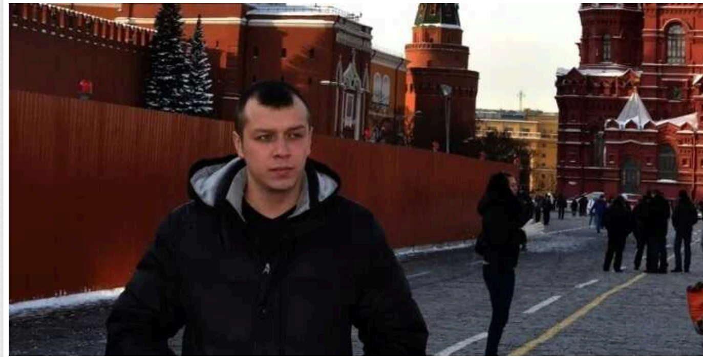
Намагалися зупинити танки для ЗСУ: депутати Бундестагу виконували доручення агента ФСБ, – ЗМІ