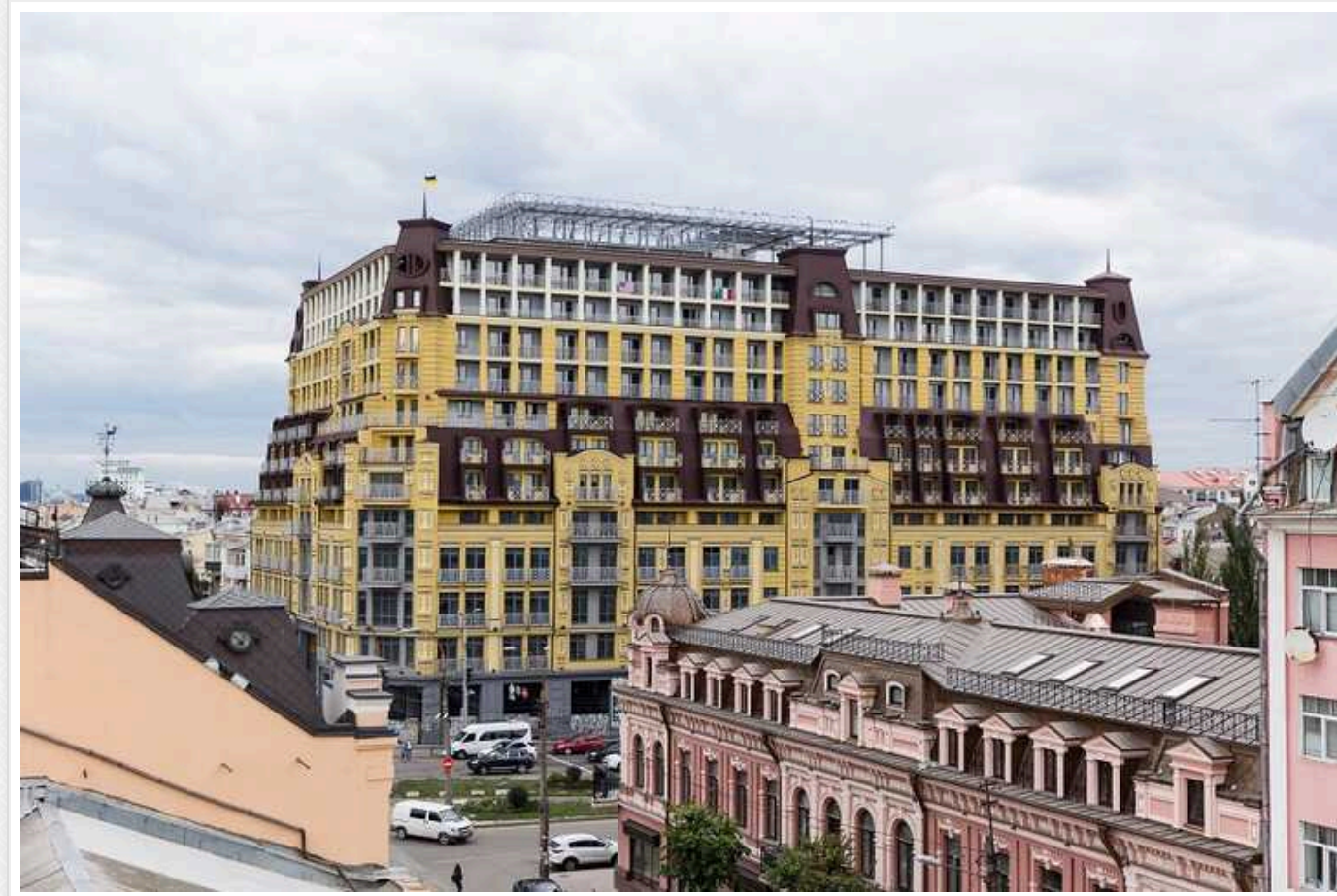
У скандальному будинку в Києві почали продавати квартири: власники задирають ціни вище за ринкові

Власники квартир у проблемному київському "Будинку-монстрі на Подолі" почали продавати своє житло. При цьому ціни виставляють вище за ринкові. Наприклад, 130-метрову 2-рівневу 5-кімнатну квартиру із зимовим садом та видом на Андріївську церкву власник оцінив у 390 тис. доларів – тоді як у сусідньому преміальному ЖК ціни на порівняні за площею квартири значно нижчі.