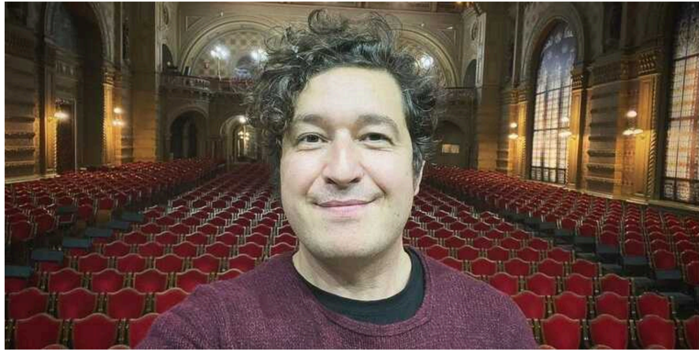
Музикант Дмитро Шуров заявив, що артисти мають звільнитися від служби у ЗСУ

Український співак та музикант Дмитро Шуров поділився своєю думкою щодо того, чи потрібно українських артистів відправляти на фронт із метою захищати Україну від російського агресора.