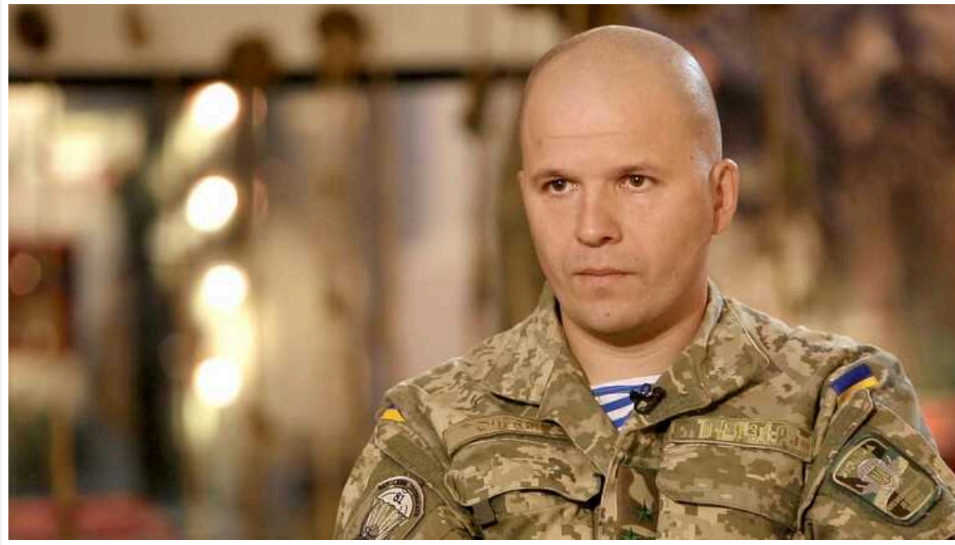
Заступника Залужного Мойсюка розглядають як кандидата на посаду нового головнокомандувача – ЗМІ

Генерал-лейтенант Євген Мойсюк може бути одним із ймовірних претендентів на посаду головнокомандувача ЗСУ замість Валерія Залужного. Наразі він є заступником Залужного.