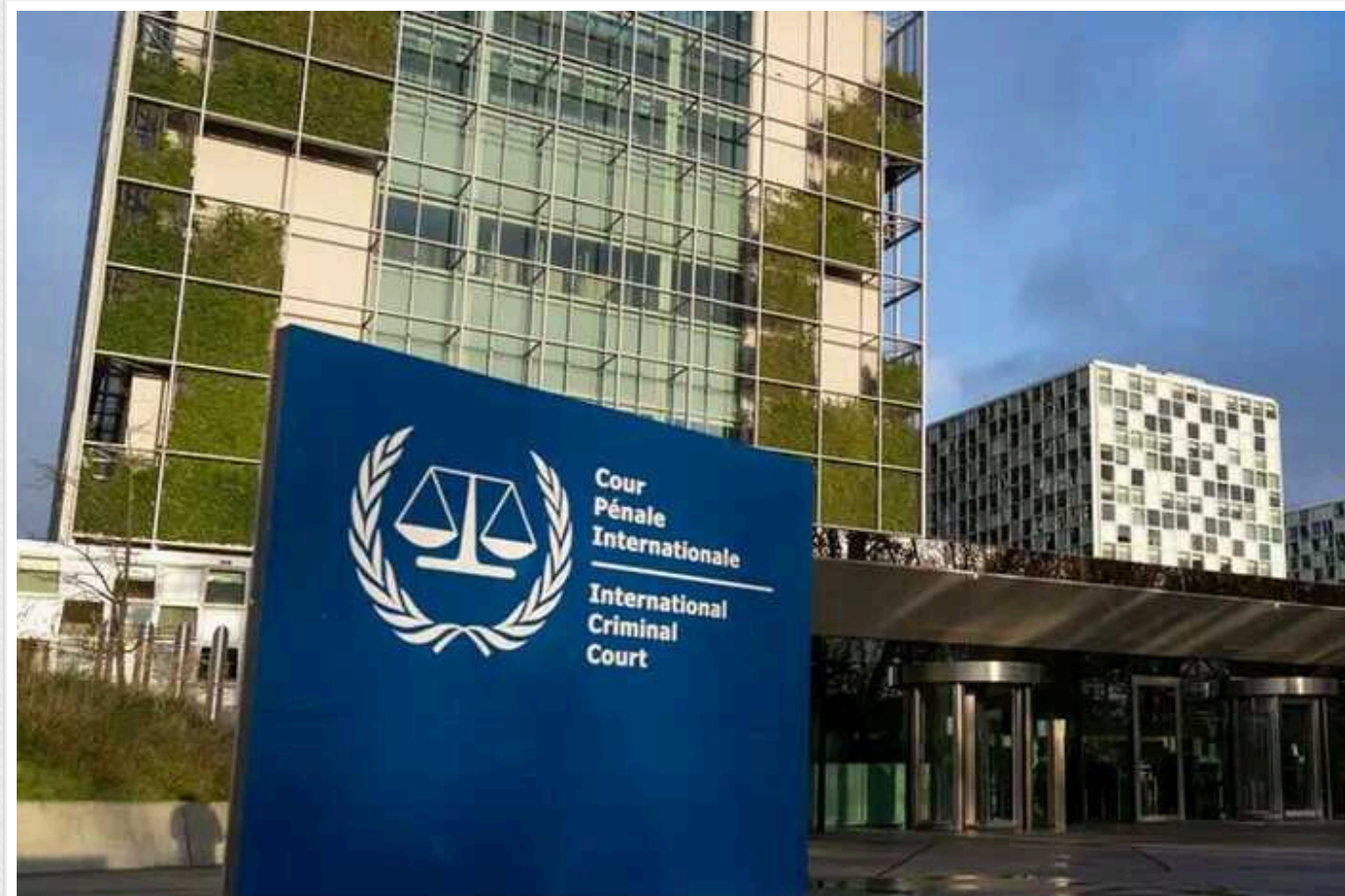
Вірменія офіційно приєдналася до Римського статуту

У Вірменії з 1 лютого офіційно набув чинності Римський статут, на підставі якого засновано Міжнародний кримінальний суд у Гаазі. Таким чином, республіка повинна буде заарештувати російського президента Володимира Путіна, якщо той з'явиться на її території.