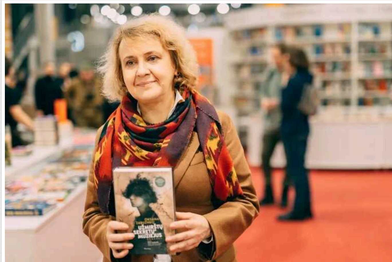
Письменниця Оксана Забужко увійшла до складу журі Берлінале

Українська письменниця Оксана Забужко увійшла до складу міжнародного журі Берлінського кінофестивалю, який пройде цього року. Разом із європейськими та американськими зірками вона оцінюватиме фільми, які боротимуться за "Золотого ведмедя" і не тільки.