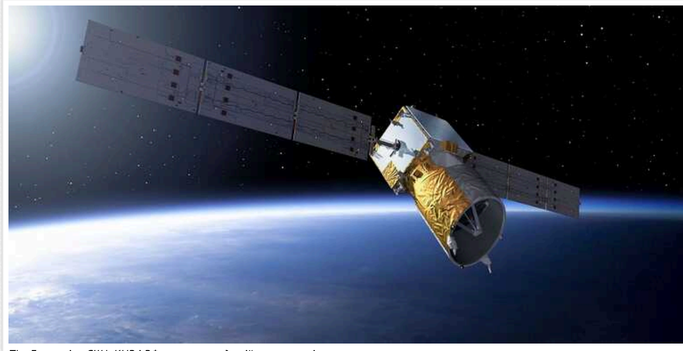
The Economist: США, КНР і РФ готуються до війни у космосі

The Economist стверджує, що війна в космосі більше не наукова фантастика: протистояння Китаю і РФ Америці вже стало реальністю.