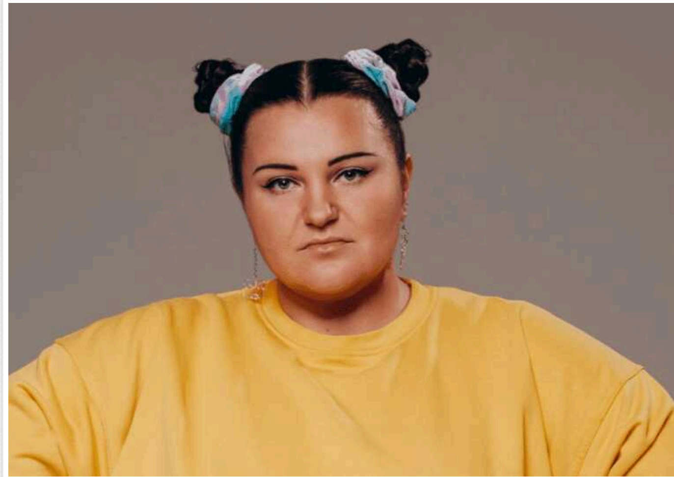
Реперка Альона Альона збирається подати в суд на блогерів, які назвали її "хабалкою"

Скандал навколо реперки Альони Альони набуває оберті. Артистка планує подати до суду на блогерів, які продовжують принижувати її честь та гідність. Зокрема, мова йде про ведучих ютуб-каналу "Ісландія ТВ".