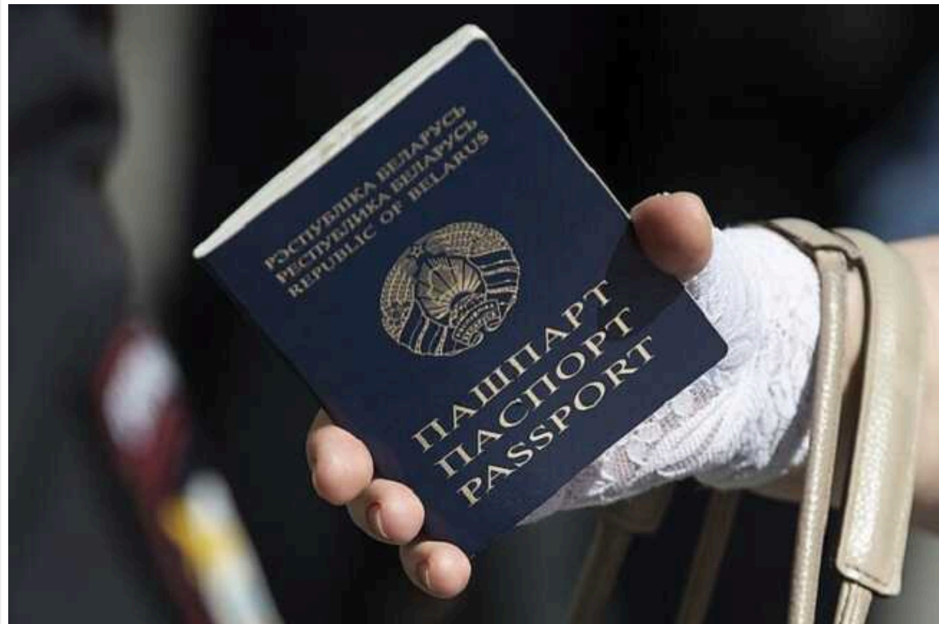
Литва ввела обмеження проти майора з Білорусі: причетний до придушення мітингів

Департамент міграції Литви сьогодні, 1 лютого, анулював посвідку на проживання, виданий майору з Білорусі Олександр Мацієвичу. Він причетний до придушення мітингу 2020 року.