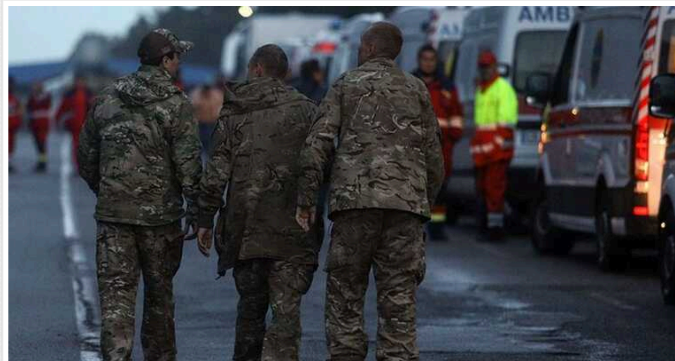
Зеленський показав щемливе відео зі звільненими полоненими: "Пам'ятаємо про всіх"

Президент України Володимир Зеленський показав щемливе відео зі звільненими полоненими українськими захисниками. Він наголосив, що влада пам'ятає про всіх своїх людей, які тимчасово знаходяться в лапах ворога.