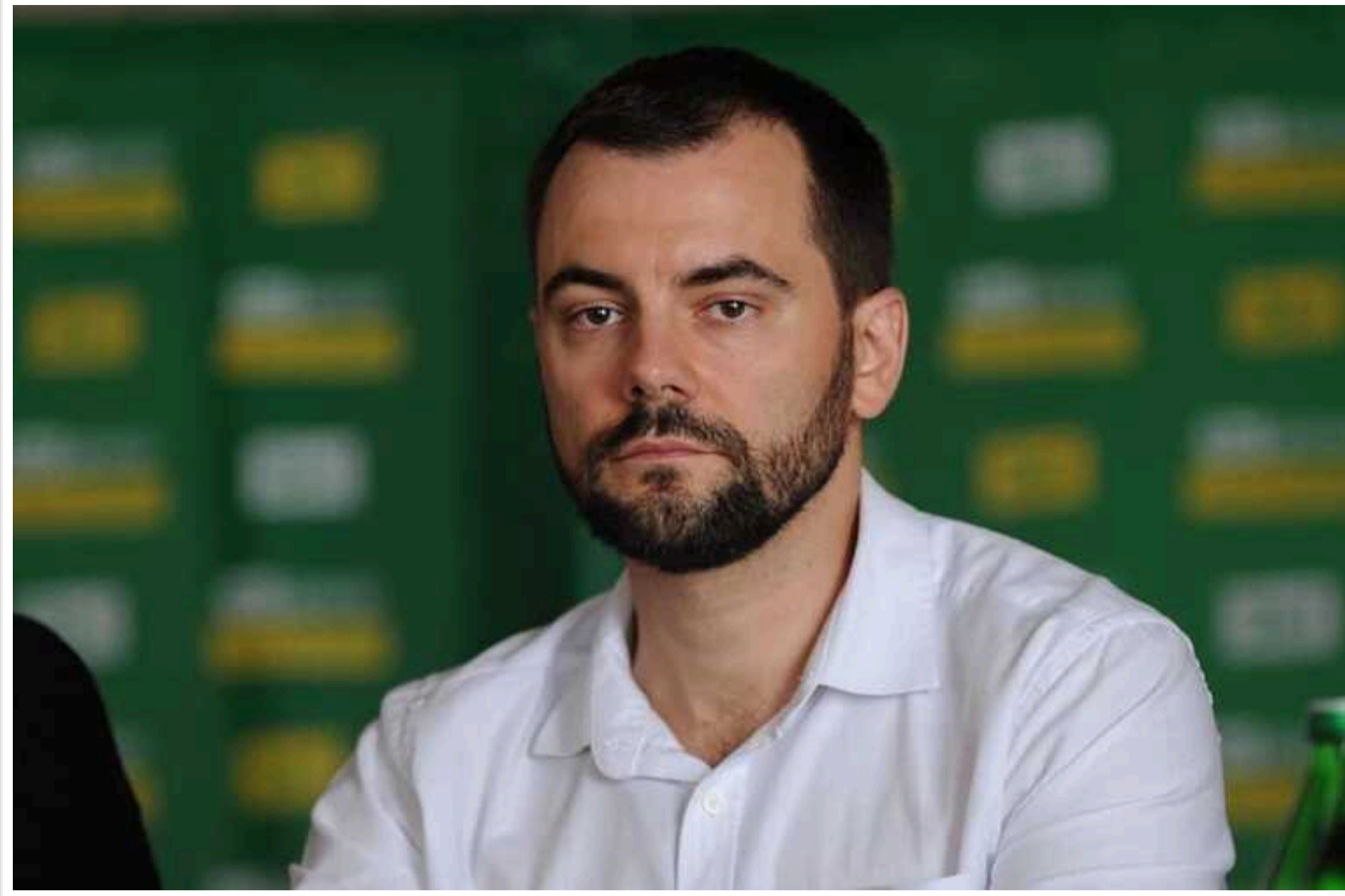
САП оголосила про підозру нардепу Олександр Маріковському: привласнив чужий криптогаманець на 25 мільйонів гривень

Прокурори САП оголосили про підозру народному депутату, який міг зазначити свідомо недостовірну інформацію при заповненні щорічної е-декларації.