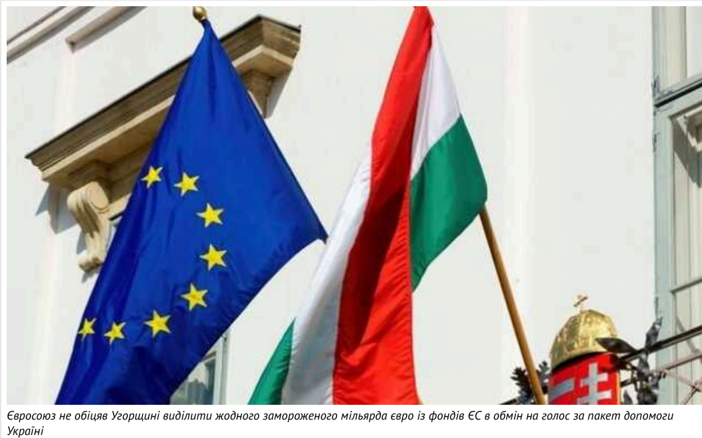
Євросоюз не обіцяв Угорщині виділити жодного замороженого мільярда євро із фондів ЄС в обмін на голос за пакет допомоги Україні

Про це повідомляє Reuters із посиланням на джерела.