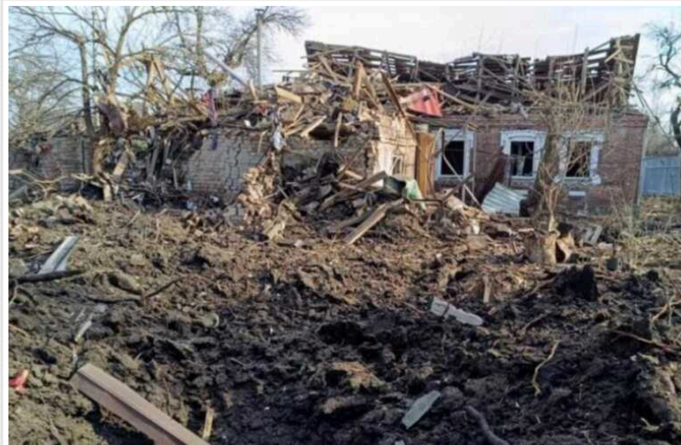
Окупанти продовжують масово руйнувати мирні міста у Донецькій області

Російські окупанти обстрілюють Донецьку область із «Градів», «Ураганів» та артилерії, вчора під вогнем було 11 населених пунктів.