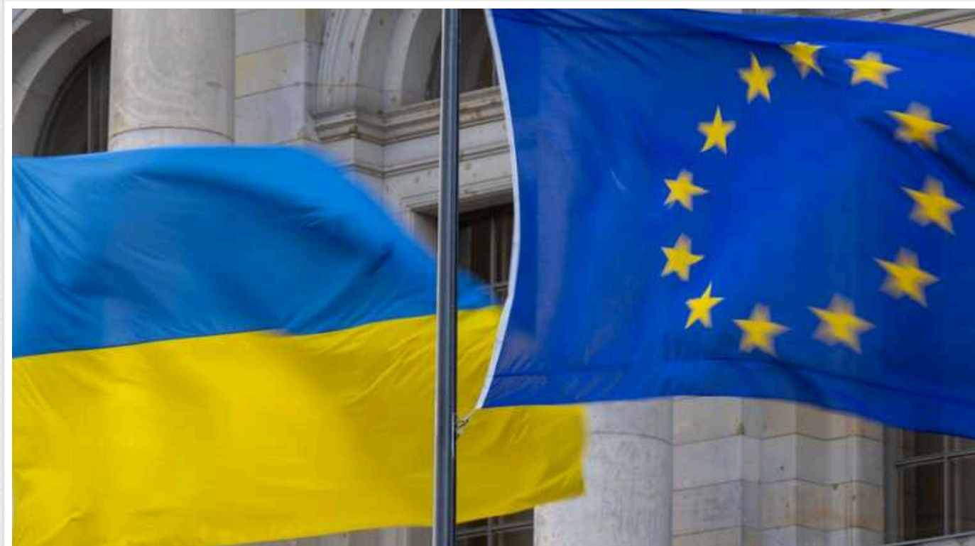
Пакет допомоги Євросоюзу Україні прийнято з двома умовами Угорщини, - The Guardian