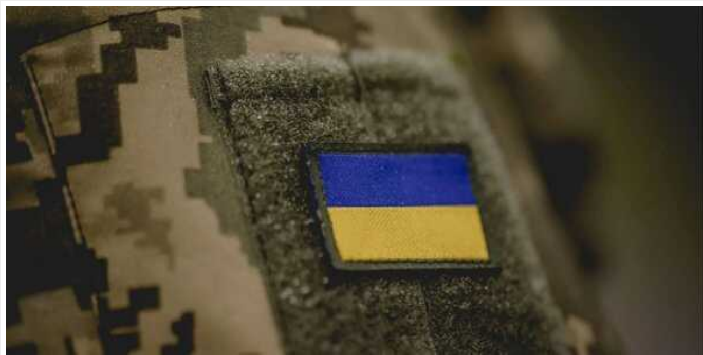
З якого моменту електронна повістка вважатиметься врученою

Кабінет міністрів вніс до Верховної Ради новий законопроект №10449, який передбачає цілу низку змін у процесі мобілізації. У документі йдеться, зокрема, про електронні кабінети військовозобов'язаних.