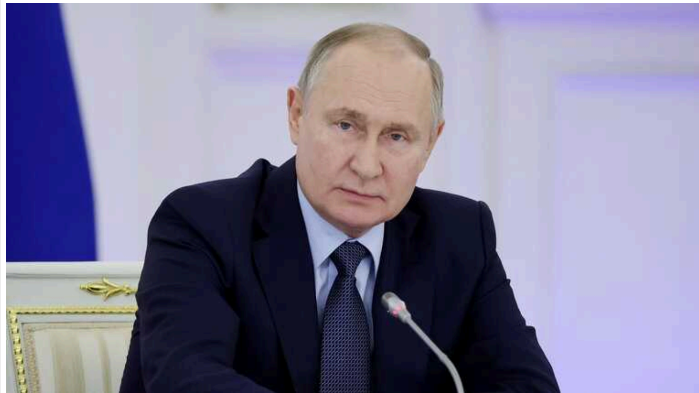
Путін хоче посунути лінію фронту в Україні: в ISW пояснили, що стоїть за заявами глави Кремля

Російський диктатор Володимир Путін вкотре посилив свої максималістські та навмисно розпливчасті територіальні цілі в Україні. Він заявив, що найважливішою з них є просування нинішньої лінії фронту вглиб українських територій.